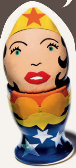
chef de chantier